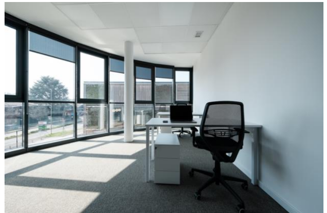
Sopra e sotto, immagini degli uffici del Centro Regus di Como, il primo interamente sviluppato e gestito da BELL Flex, inaugurato ad aprile 2023.